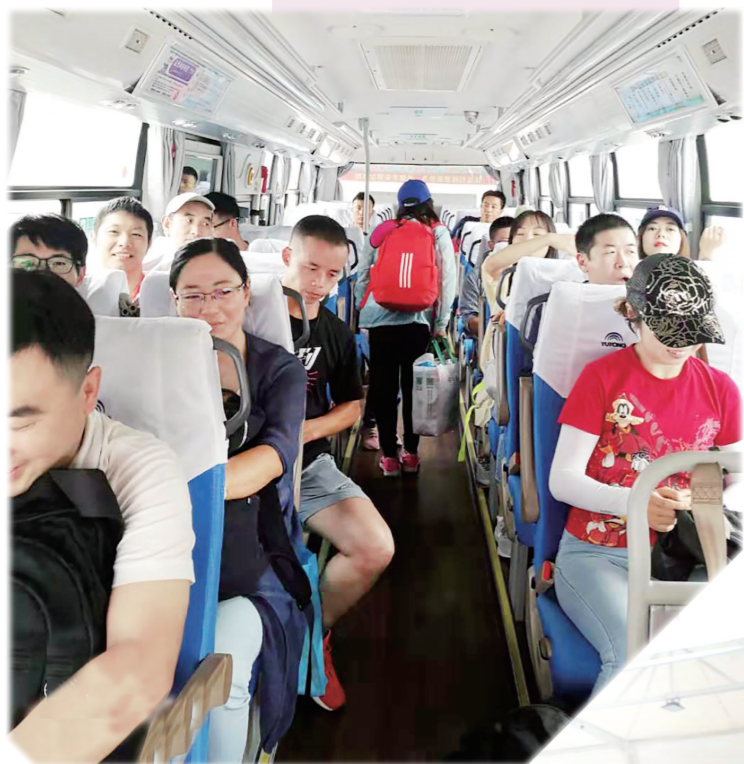
东康公司为参加2019年鄂尔多斯市国际马拉松活动的运动员提供运输保障服务。