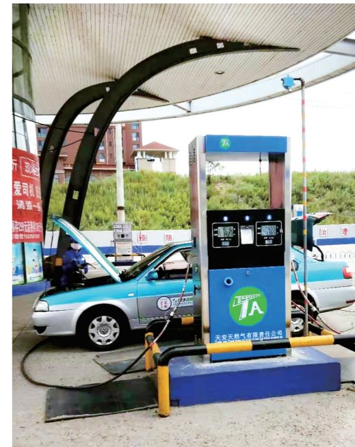
8月17日,天然气公司更换了两台新加气机,目前所有调试工作全部结束,已正式投入运营。