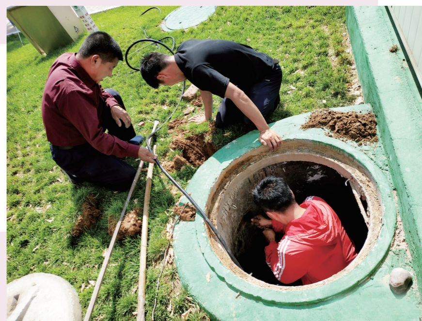
天骄北路两边园林市政施工拆除大树樁木,造成路两旁候车亭全部断电,广告公司维护人员历经两周时长,经数次检修,不顾脏累,重新布线接电,最终使设施设备正常运转。